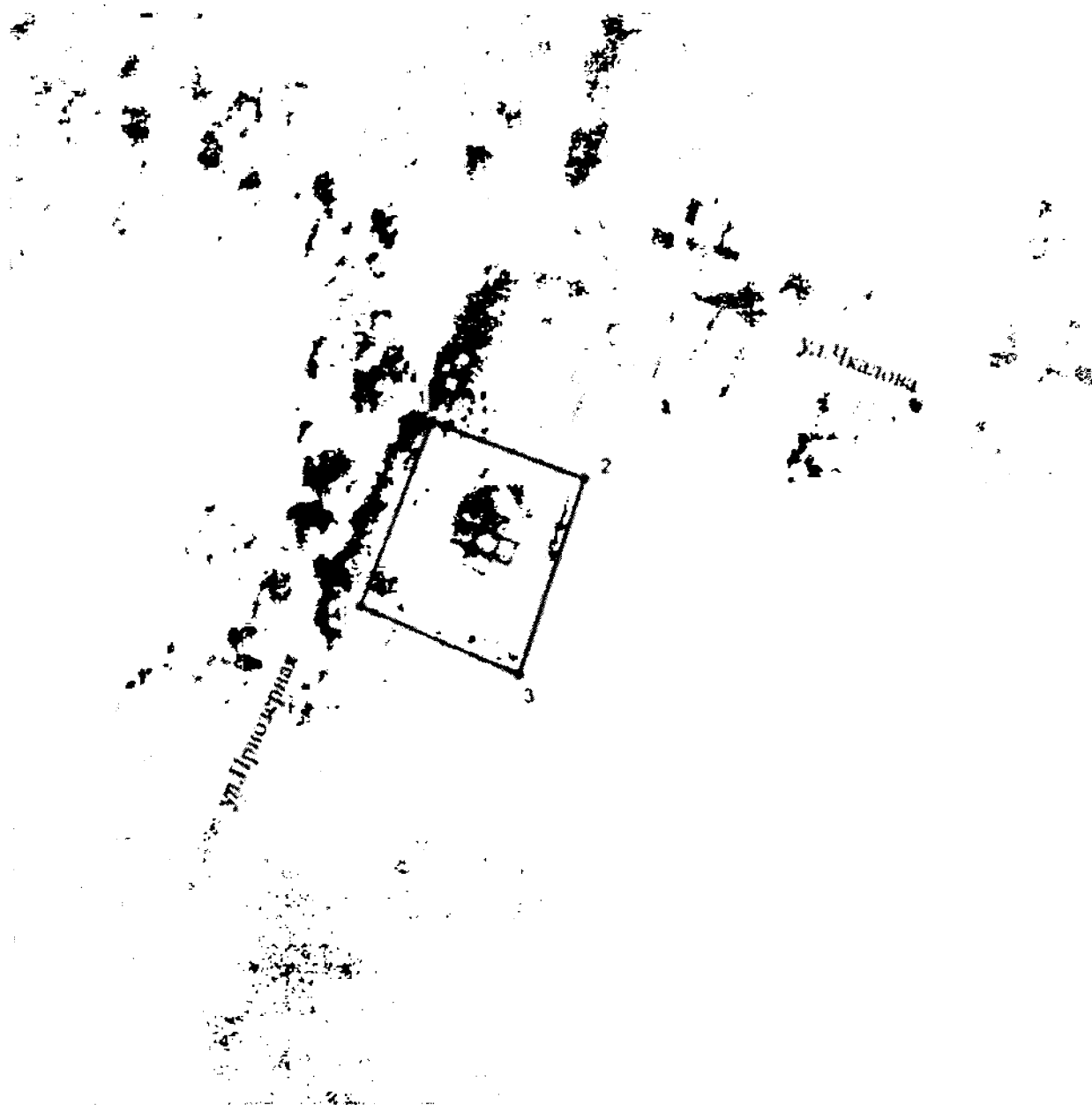
Схема границ территории объекта культурного наследия регионального значения «Церковь Покровская»